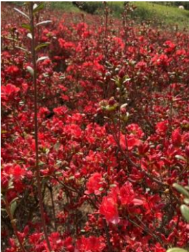
[開花情報] 地域内の開花、花壇などの見どころ情報