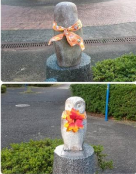
[クリーンサークルの清掃事例] 児童の活動参加