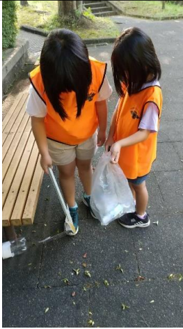
[クリーンサークルの清掃事例] 児童の活動参加